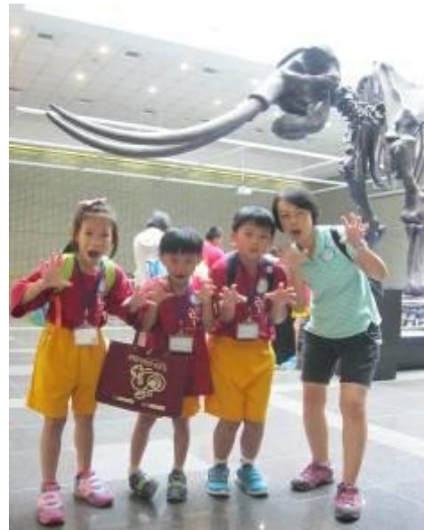
校外教學之台中科博館