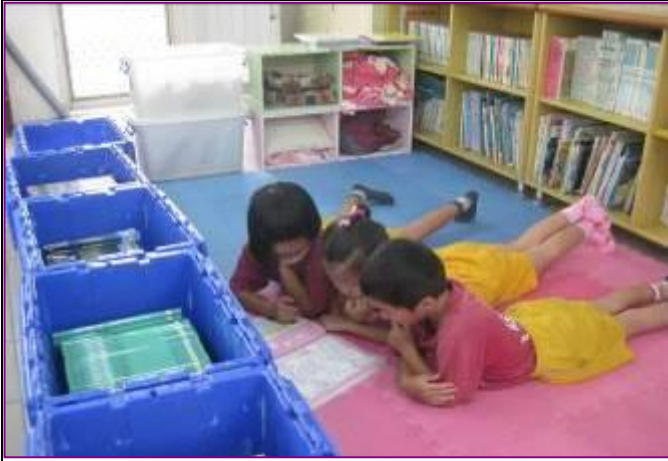
愛的書庫是我們尋寶的寶藏