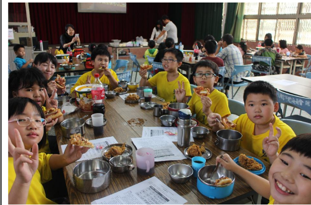
1051221 冬至多元才藝展演