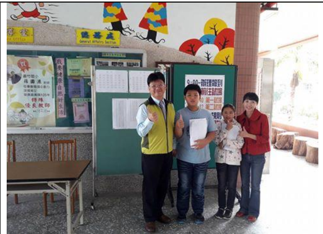
1051209 英語單字王比賽榮獲特優