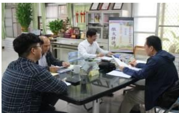
田園樂生活最嘉新住民-徵文比賽