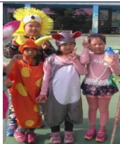
多元文化成果發表