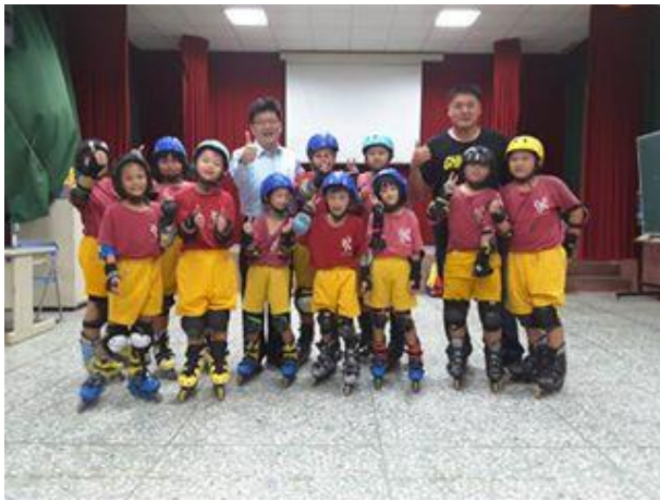
1050927 碧潭國小直排輪讚