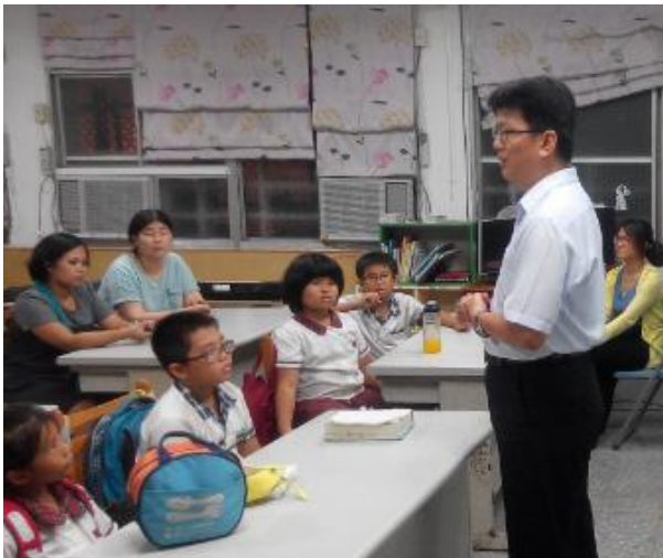
學生 & 家長一同參加始業式