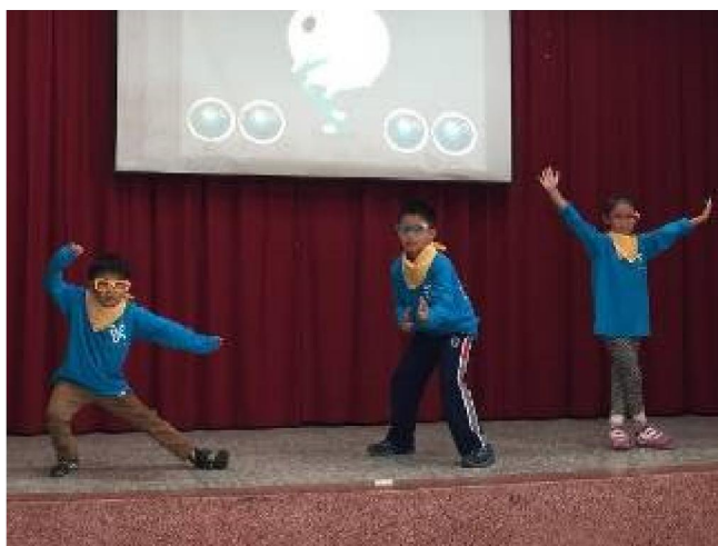
帥氣的 ending pose!