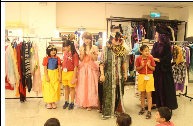
1050923 嘉義縣表演藝術中心校外教學