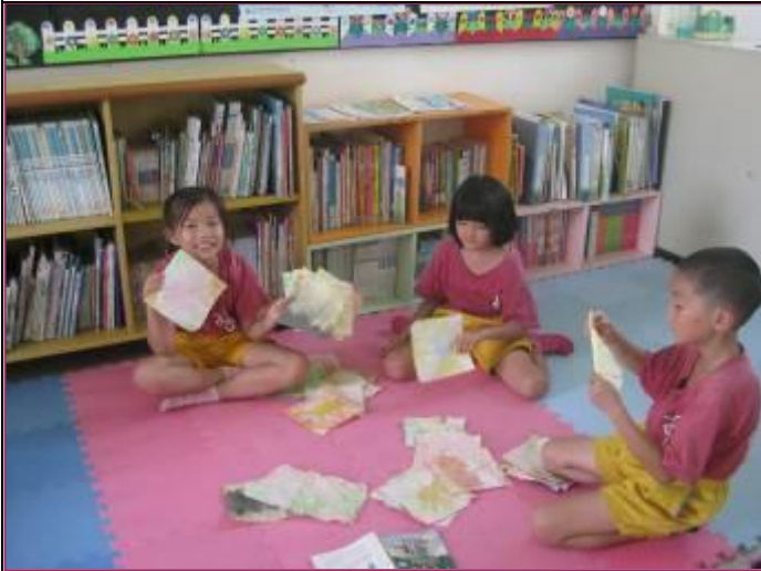
生活課程中的渲染