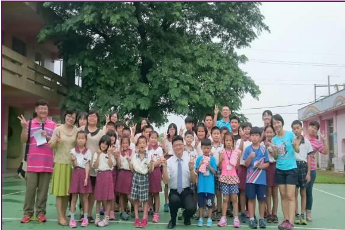
碧潭國小 105 學年度『小一新生迎新活動』與家長合影 (105.8.29)