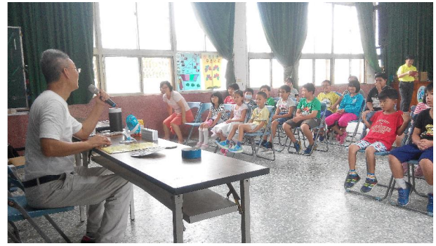
1051012 田園老師科普課程