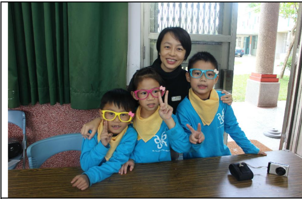
1051221 冬至多元才藝展演