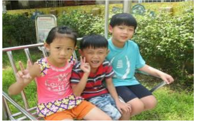
校園探索之開心搖椅搖啊搖~