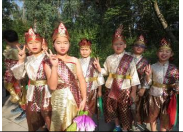
以假亂真的泰國裝扮