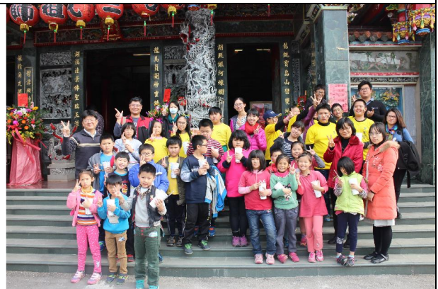
1051230 龍湖宮表演社區踏查