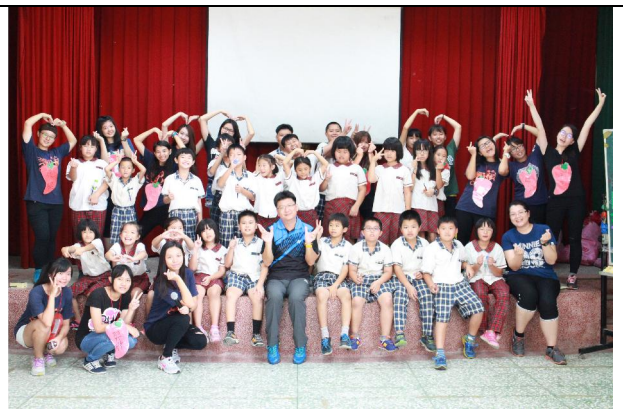
1051031 長庚科技大學熱舞社