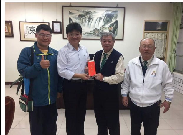
1051226 宇宙光功德會捐贈獎學金