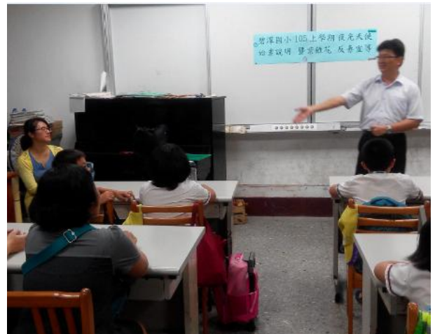
校長介紹本學期夜天使藝文老師