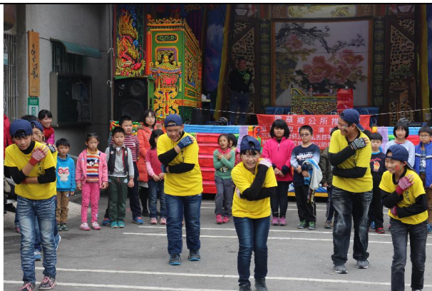
1051230 龍湖宮表演社區踏查