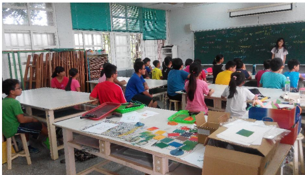
1051001 鹿草國中週六英語營