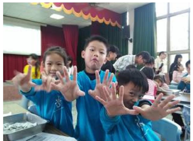
五行貓耳朵捏捏捏