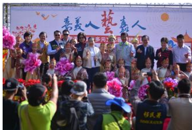
幸福在嘉 多元文化國際日表演