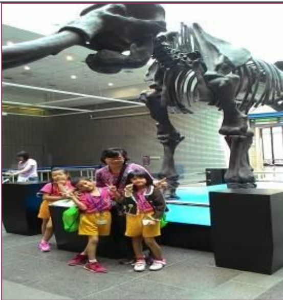
台中科工館巡禮留影