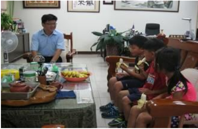
校園探索之一校長熱情款待