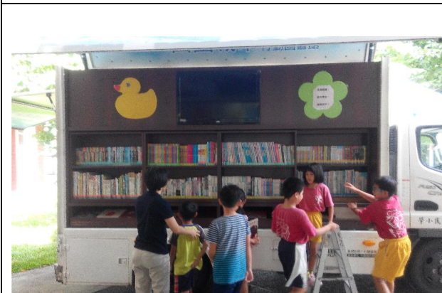
1050913 田園城市行動圖書車