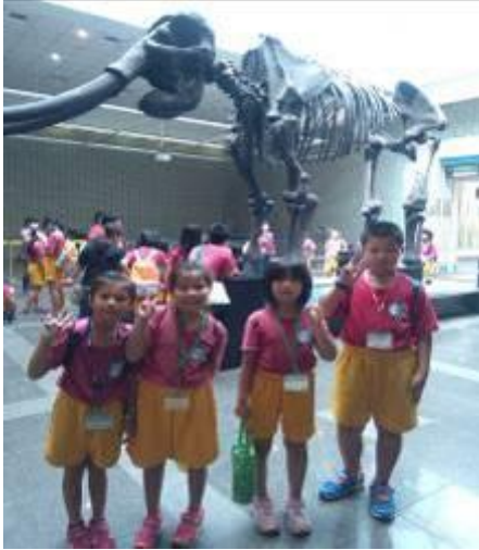
校外教學－臺中科博館