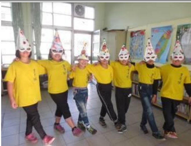
聖誕趴之猜猜我是誰？！