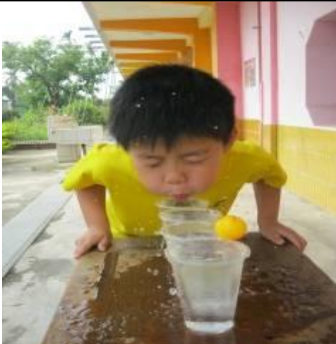
風之體驗活動-八仙過海