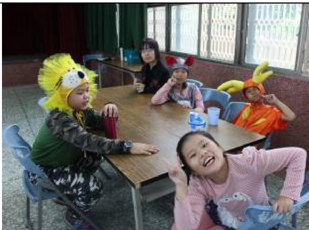
多元文化成果發表