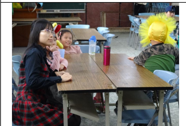
1051221 冬至多元才藝展演