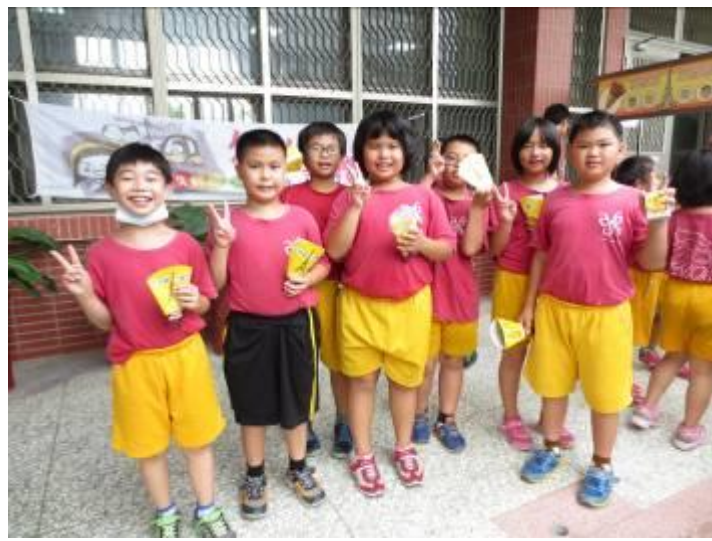
散播愛與勇氣的可麗餅