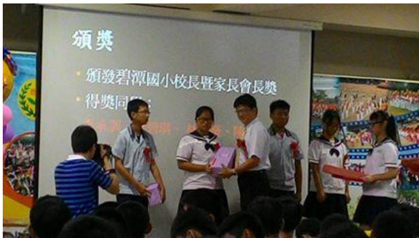
1050621 鹿草國中畢業典禮頒獎