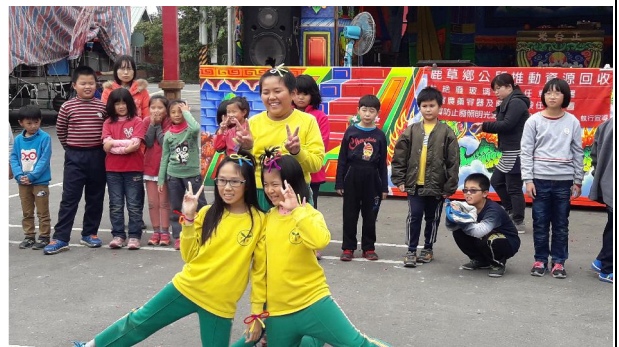
1051230 龍湖宮表演社區踏查