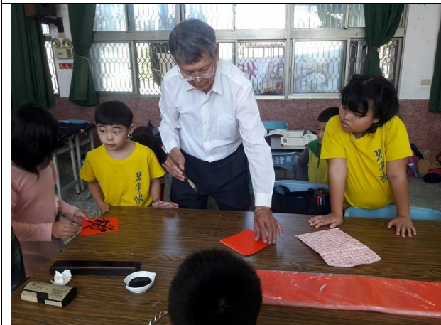
1051221 週三書法社團寫春聯