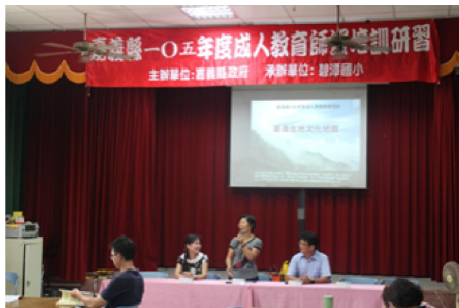
成人教育師資培訓