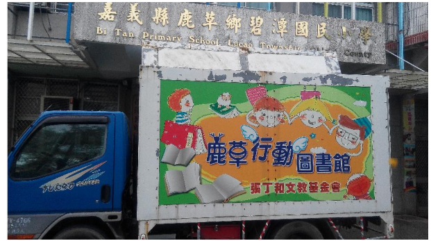
1051018 鹿草張丁和圖書車