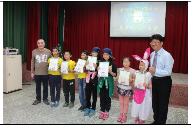
1051221 冬至多元才藝展演