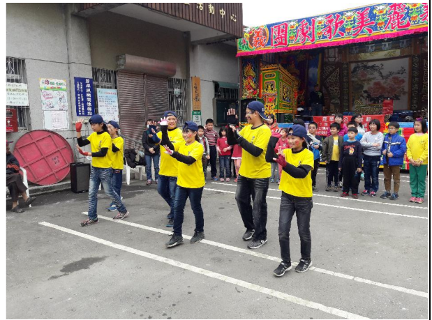
1051230 龍湖宮表演社區踏查