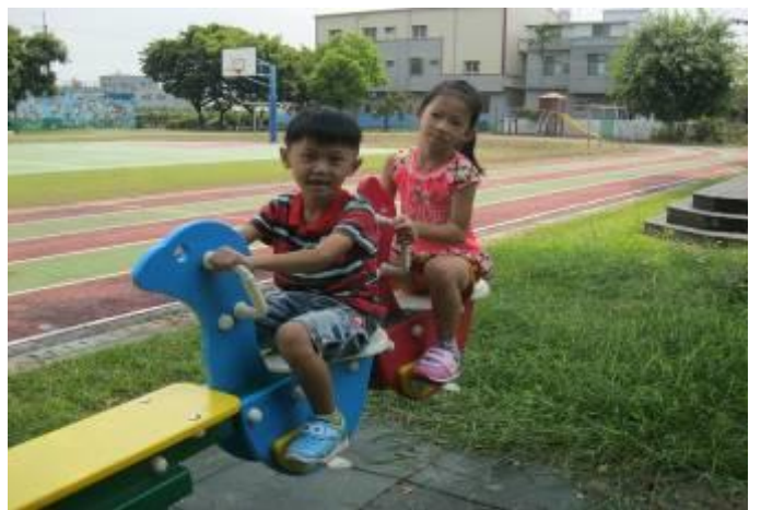
YA~我最喜歡下課時光了!