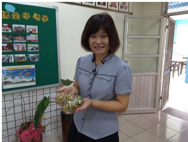
1050908 素芬姐送全校月餅