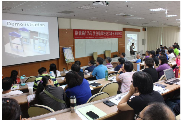
1050825 防災種子教師研習