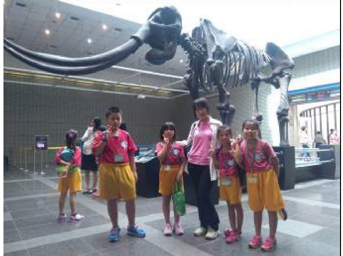
校外教學－臺中科博館