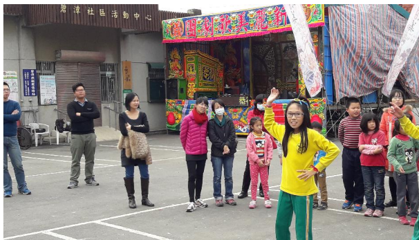
1051230 龍湖宮表演社區踏查