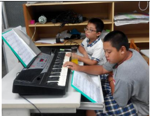
每週一電子琴才藝學習