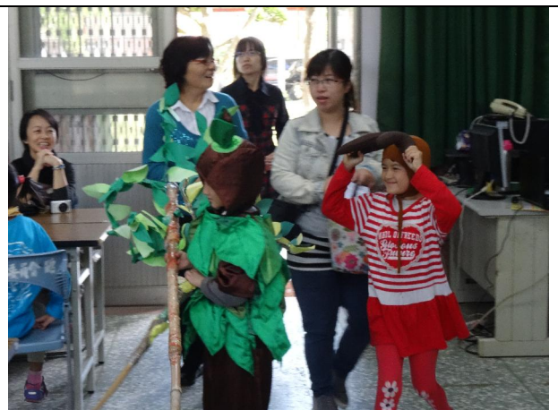
1051221 冬至多元才藝展演