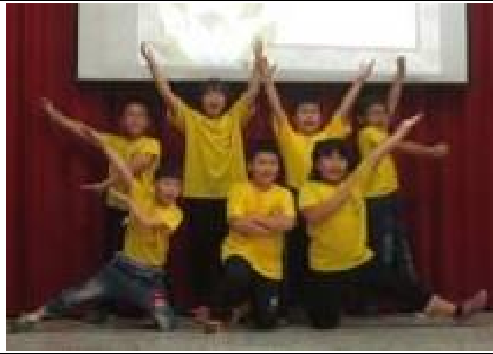
穿越古今的唐詩吟唱