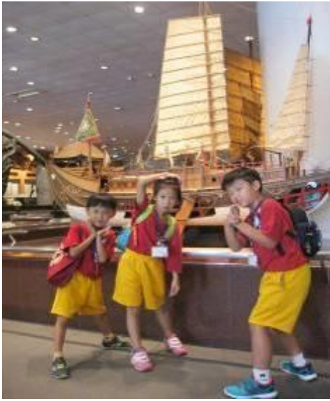
校外教學之台中科博館