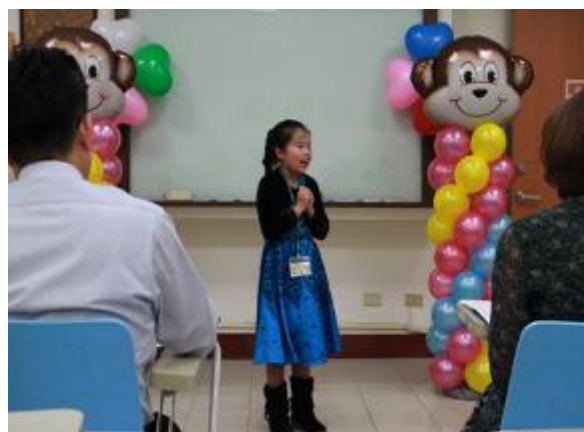
「各國文化或童話故事」說故事比賽