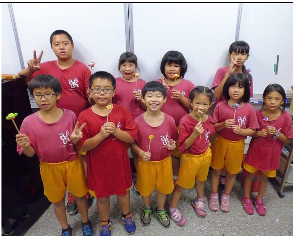
週二美勞才藝學習-黏土造型