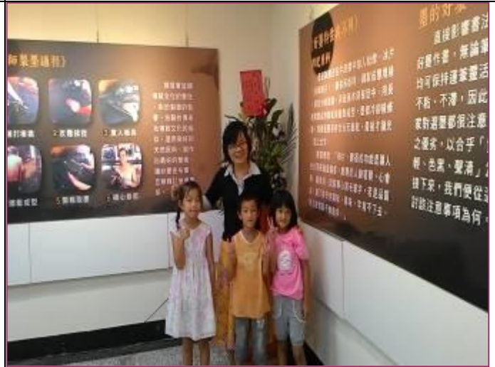
社區踏查巡禮-鹿草文花館