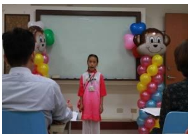
青少年越南語暨印尼語語文競賽